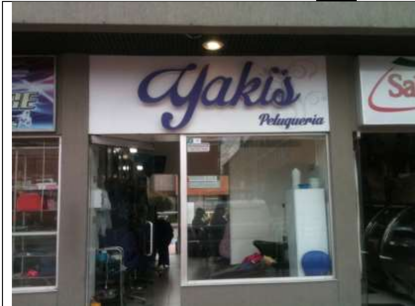
Fotografía No. 1: Avisos del establecimiento PELUQUERIA YAKI'S, No cuenta con Registro de Publicidad Exterior Visual, ubicado en la Carrera 94 No. 6 C – 30 Local 19.